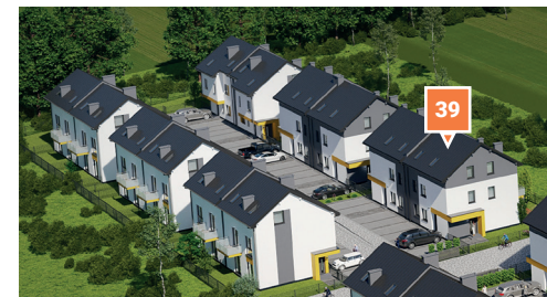
Widok osiedla z lotu ptaka